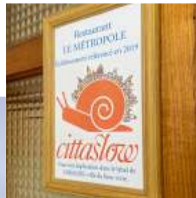
Halle de Mirande