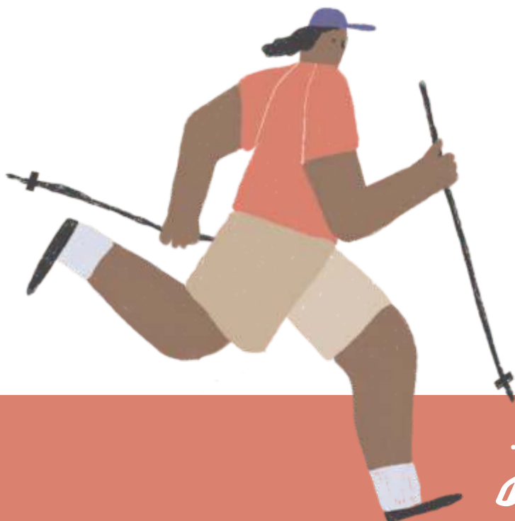
ILLUSTRATION KATIA DERBEL

On l'appelle à tort un village, mais on aime son côté campagnard. On s'impatiente pour vingt secondes de trafic et pourtant, on y apprécie la fluidité des routes au retour d'un séjour en ville. On s'attriste de revenir de vacances, mais on réalise rapidement que c'est un lieu de villégiature où l'on peut se sentir en congé à l'année.